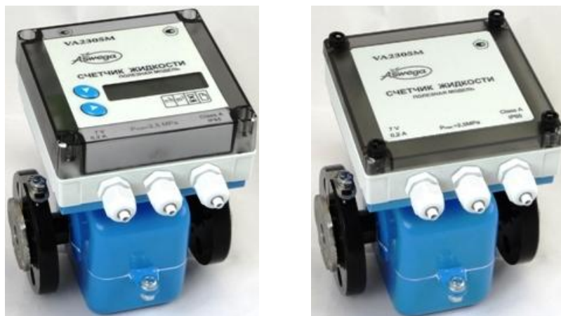
Рисунок 1 – Общий вид счётчика VA2305M (с ЖКИ и без ЖКИ)

Общий вид счётчиков в двух вариантах исполнения (с ЖКИ и без ЖКИ) показан на рисунке 1.